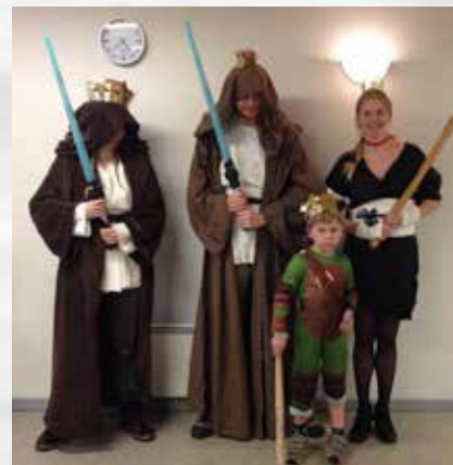
Stolte kattedronninger og -dronninger Fastelavnssøndag i Lerbjerg

Når dette blad udkommer, vil der være afholdt generalforsamling i borgerforeningen og i vandværket. Nærmere følger.